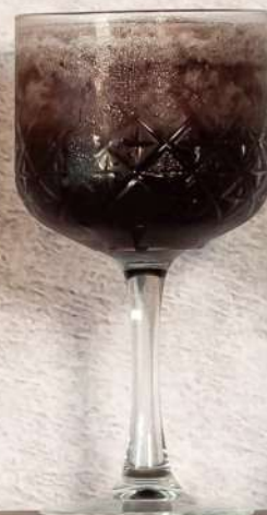
Wild Berry 250 ml - 22 lei