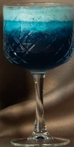
Blue Ice 250 ml - 22 lei