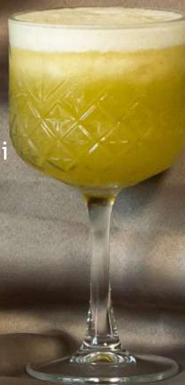
Măr verde 250 ml - 22 lei