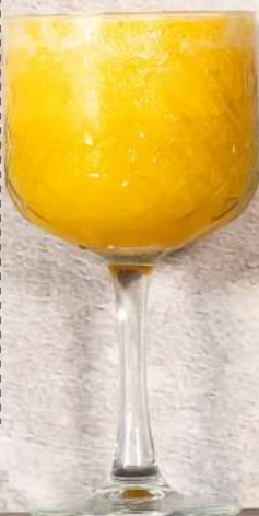
Pepene galben 250 ml - 22 lei