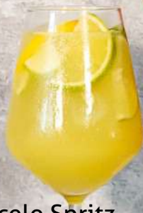
Limoncelo Spritz 300 ml - 31 Lei