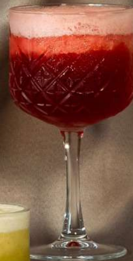
Pepene roșu 250 ml - 22 lei