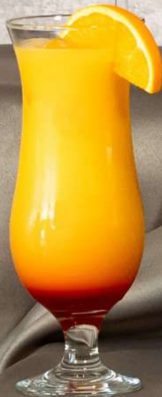
Tequila Sunrise 250 ml - 31 Lei