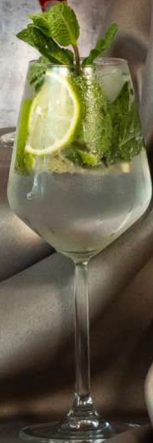
Mojito 300 ml - 33 Lei