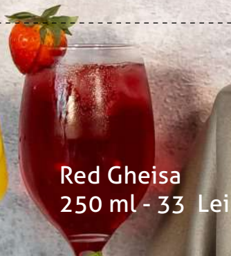
Red Gheisa 250 ml - 33 Lei