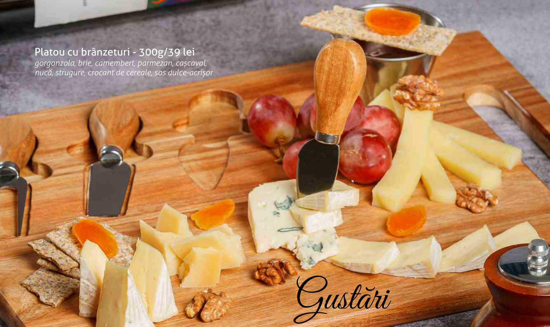
Platou cu brânzeturî - 300g/39 lei gorgonzola, brie, camembert, parmezan, cașcaval, nucă, strugure, crocant de cereale, sos dulce-acrișor