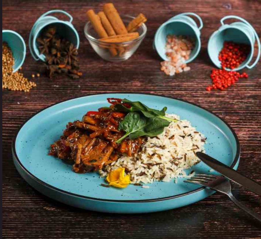
Mușchi de Porc cu 5 Arome - 450g/ 40 lei muşchiuleț de porc, 5 spices, orez sălbatic