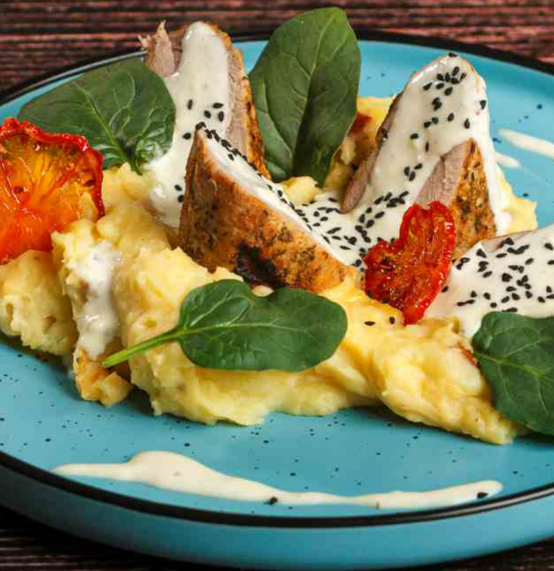
Medalion "Bleu Fromage" - 450g / 40 lei muşchiuleț de porc, piure aromat, sos de brânzeturi nobile, roșii concase