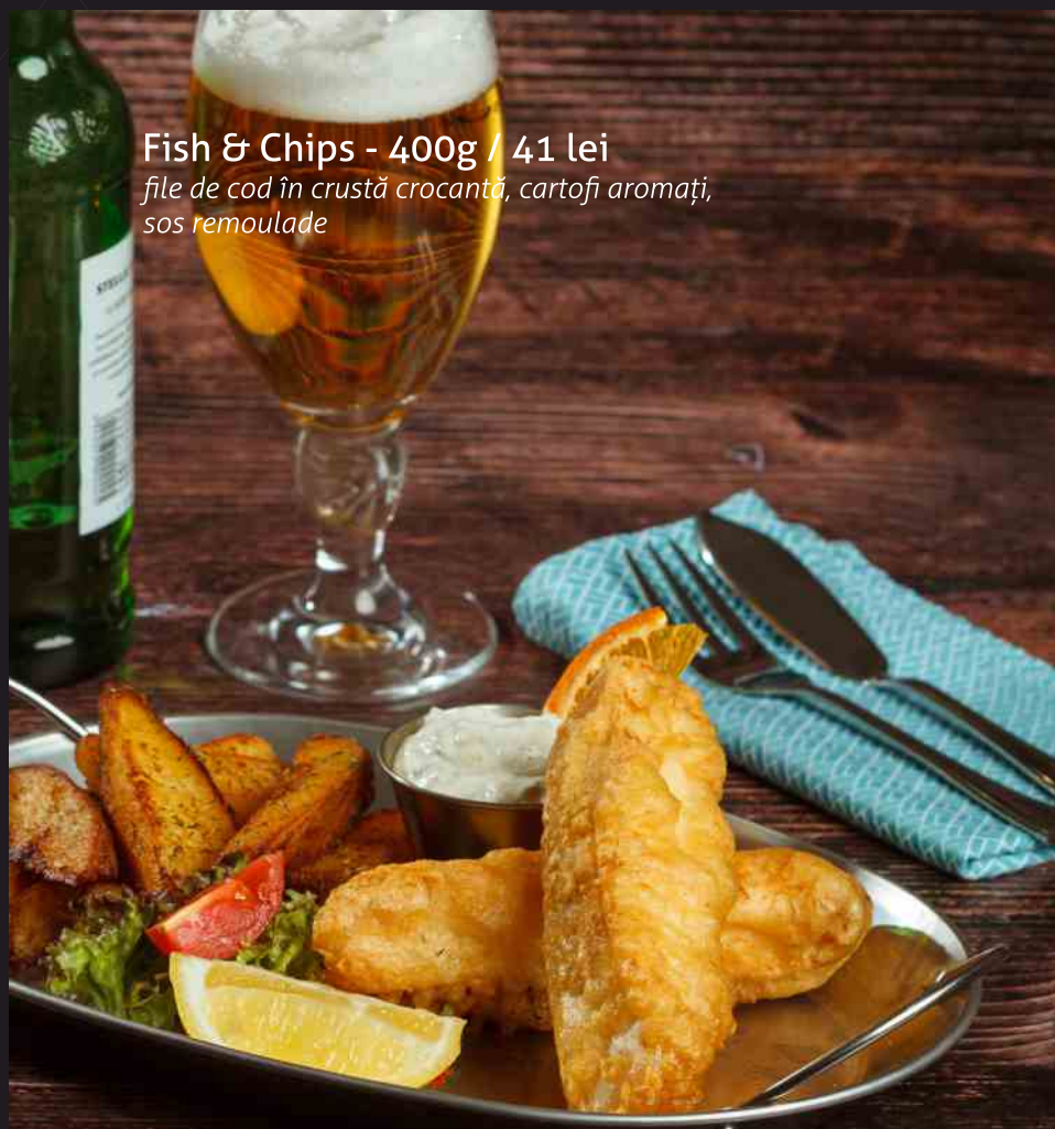
Fish & Chips - 400g / 41 lei file de cod în crustă crocantă, cartofi aromați, sos remoulade