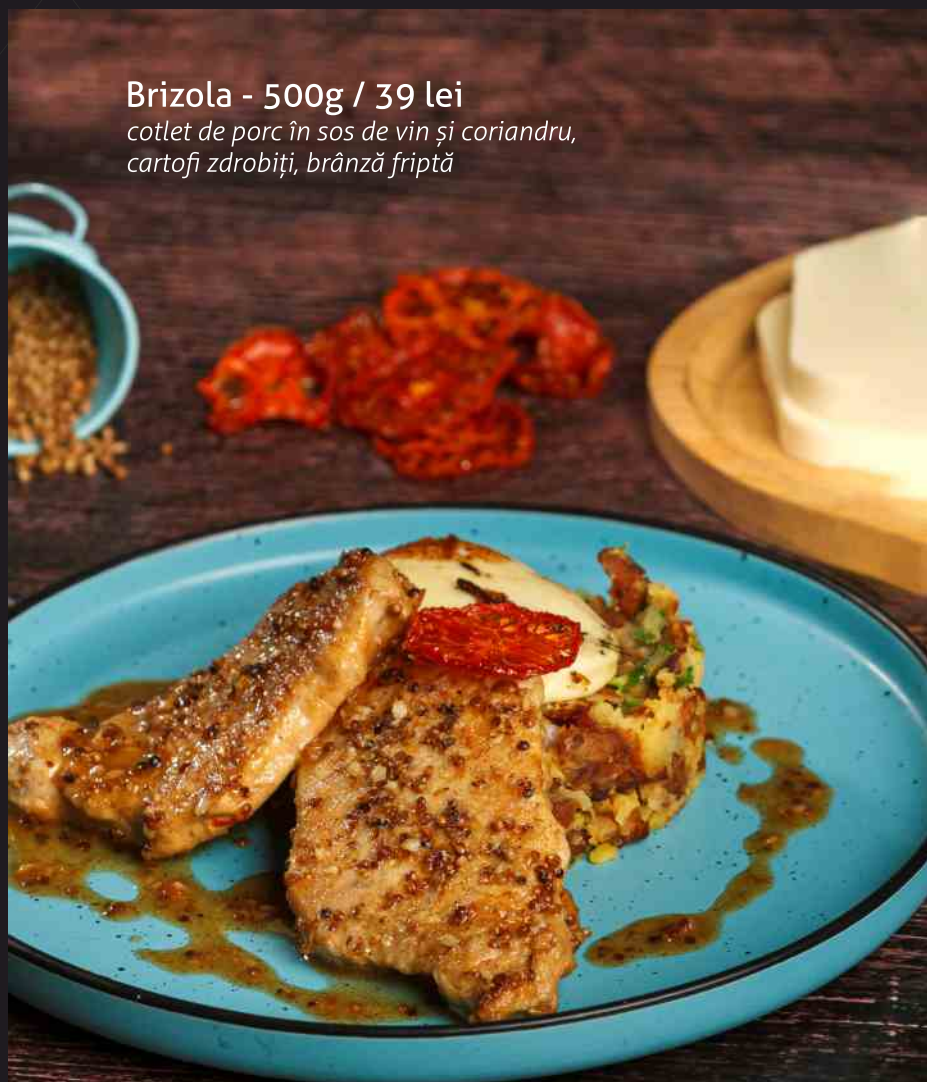
Brizola - 500g / 39 lei cotlet de porc în sos de vin și coriandru, cartofi zdrobiți, brânză friptă