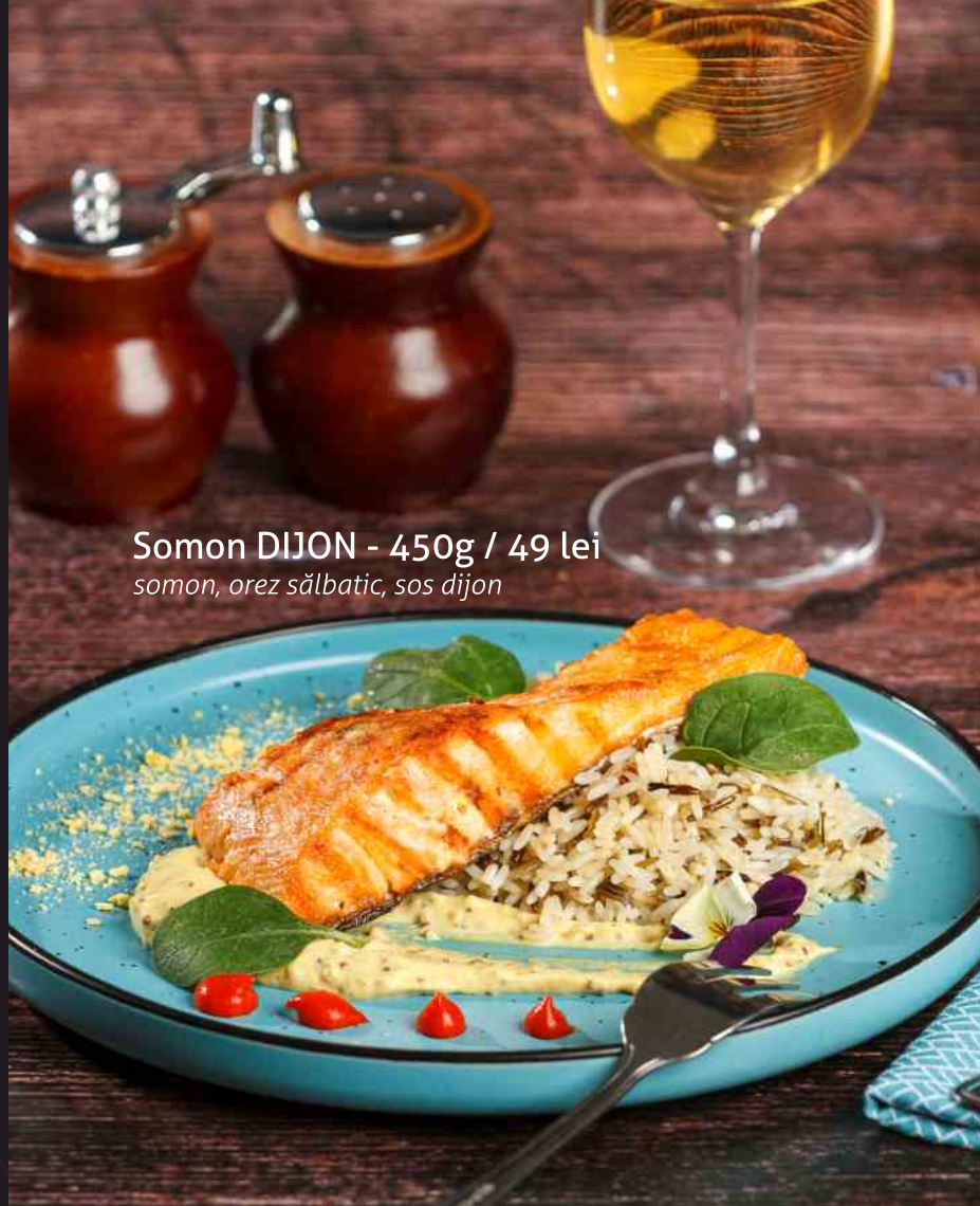
Somon DIJON - 450g / 49 lei somon, orez sălbatic, sos dijon