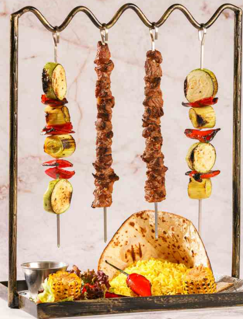
Frigărui de Berbecuț - 550g/49 lei pulpă de berbecuț marinată, legume la grătar, orez iranian, lipie, sos de iaurt