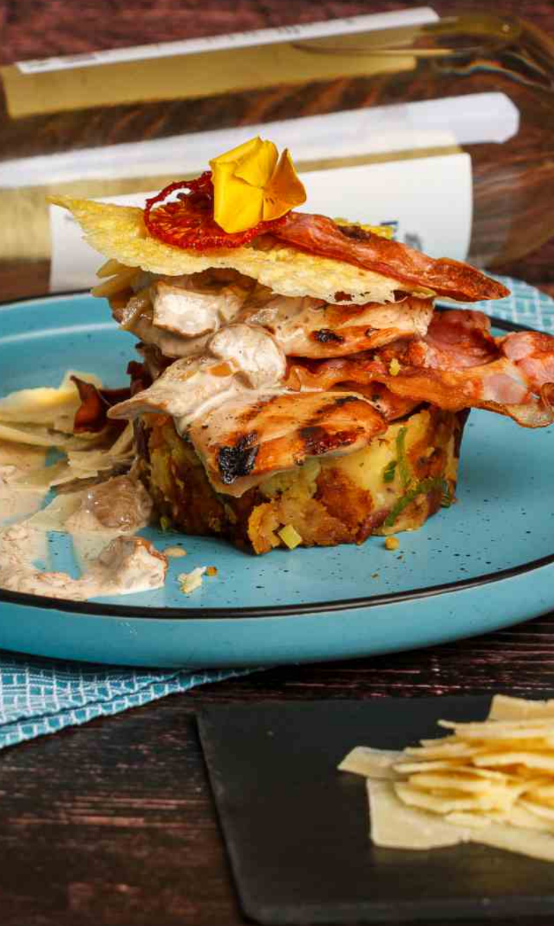
Pui "La Belle Epoque" - 450g / 37 lei piept de pui, chips de bacon, cartofi zdrobiți, sos de hribi, scale de parmezan