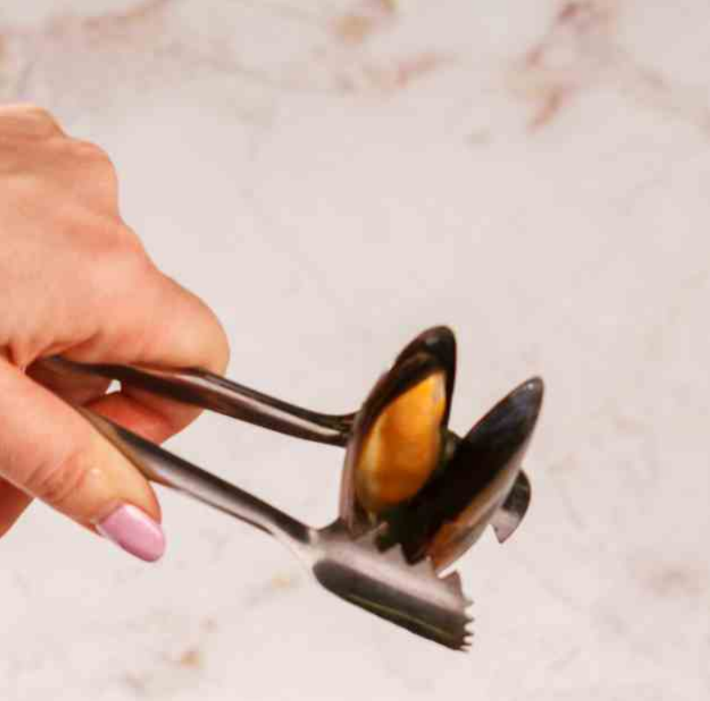
Scoici Roquefort - 750g / 55 lei midii, vin alb, roșii cherry, unt, brânză rochefort, pâine prăjită cu unt aromat