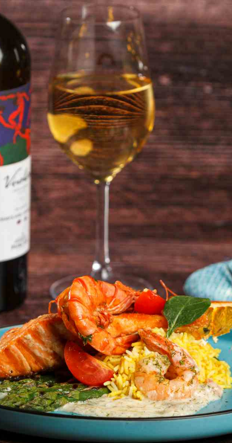
Somon cu sos de Creveți - 450g / 49 lei file de somon, sos de creveți, sparanghel, orez iranian