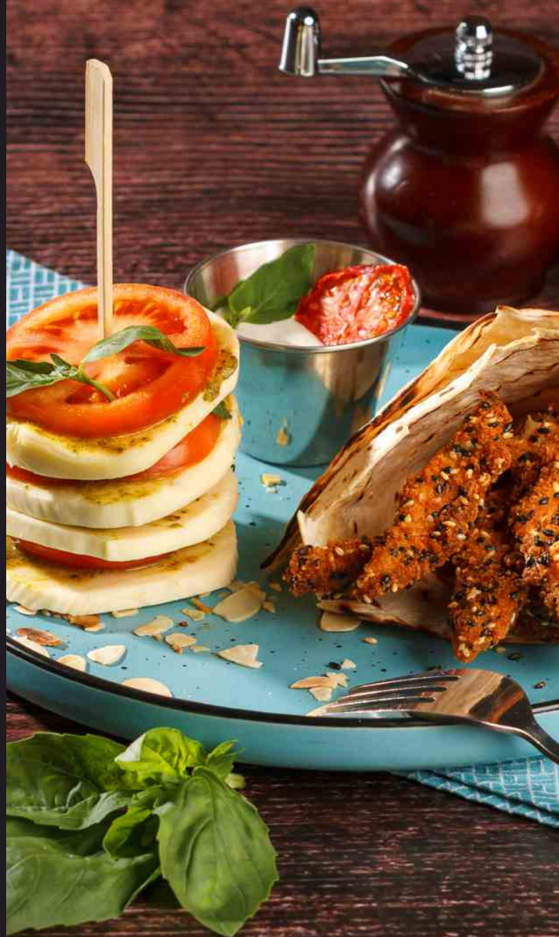
Salată Caprese Fingers - 450g/35 lei mozzarella, roșii, pesto de busuioc, lipie, piept de pui fâșii pane, fulgi de migdale, dressing