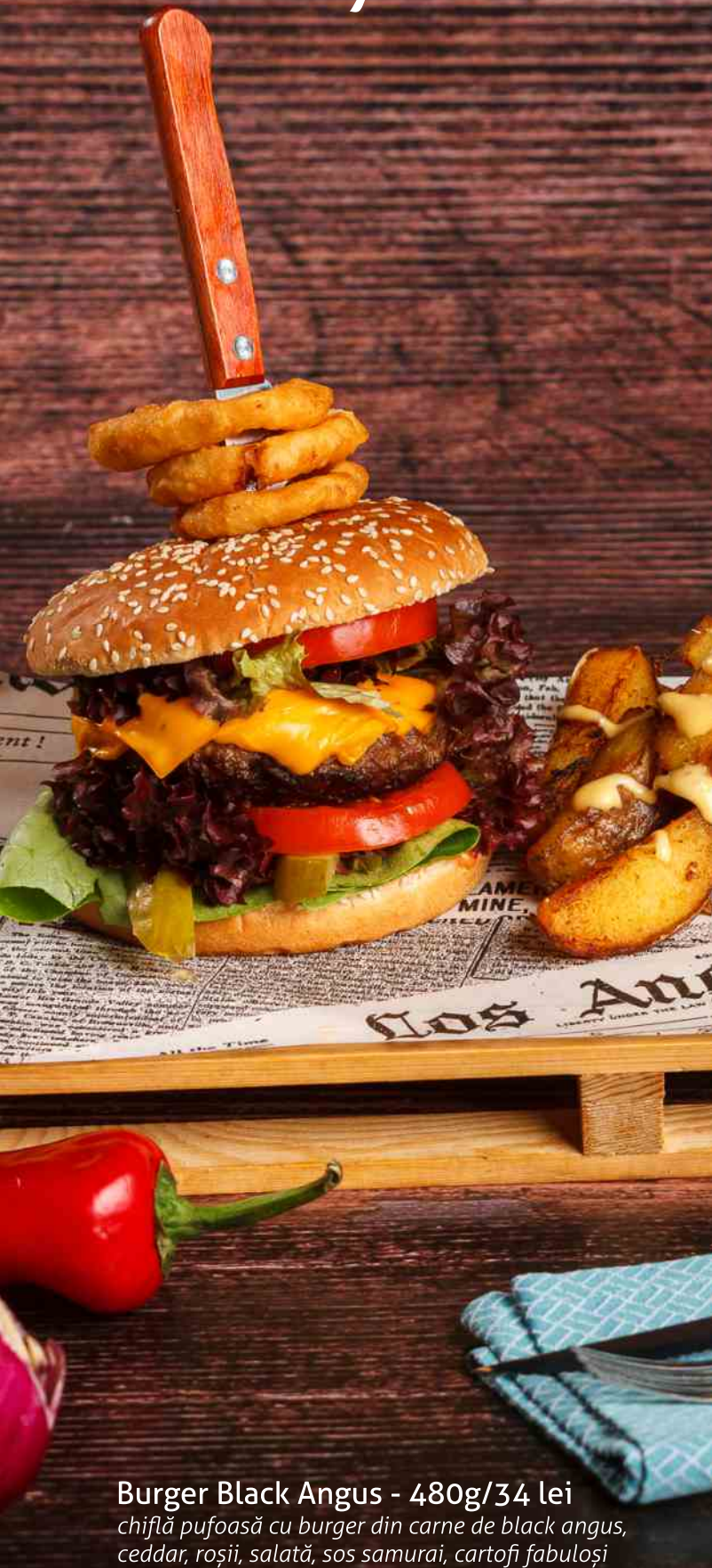
Burger Black Angus - 480g/34 lei chiflă pufoasă cu burger din carne de black angus, ceddar, roșii, salată, sos samurai, cartofi fabuloși