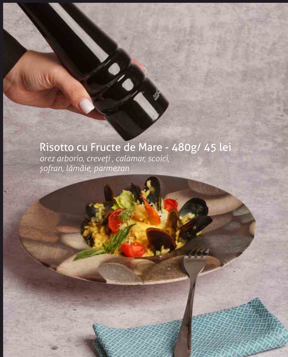
Risotto cu Fructe de Mare - 480g/ 45 lei

orez arborio, creveți, calamar, scoici, șofran, lămâie, parmezan